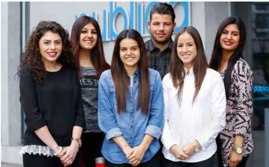
Die Lernenden von PUBLICA